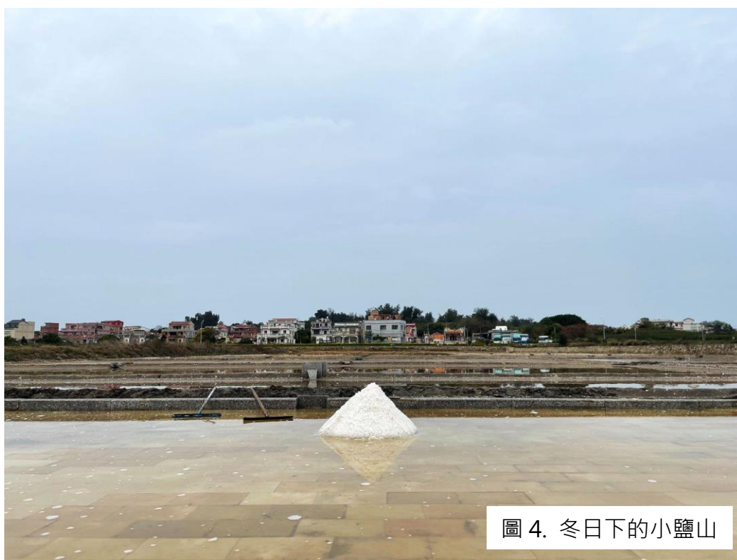
圖 4. 冬日下的小鹽山

西園鹽場悠久歷史不只顯現於對聯之中，在鹽田的結構中可見一斑。遠處的鹽田是 1938 年設計的新式鹽田，還可以看到舊有的結構——以花崗石條作分隔。近處的第一至四副則是 2010 年修復的鹽田，後來第二期則是第五副至第六副鹽田。如果鹽田的導覽能包含鹽田結構解說，實是讓遊人可以清楚了解西園鹽場的其中之一的特點——就地取材。西園鹽場結構採用花崗石條和香港以往的梅窩鹽田相似，但梅窩鹽田廢棄後結構沒有保留下來，村民把石條加工，當作地台、椅子，甚或造路之用，令石條再次重生。