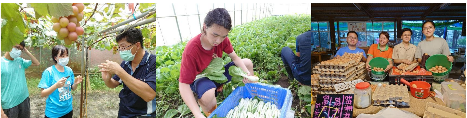
圖 1~3. 為 2022 年學生參與見習之回顧。

本活動見習時數分為 80 小時(10 天)、160 小時(20 天)、240 小時(30 天)、320 小時(40 天)四種方案，請同學填妥報名表並規劃可前往農場的日期，提供給農推會作為媒合依據。完成指定時數的同學，農推會將協助申請學生獎勵金，鼓勵學生認識農業並思考未來是否要投入這個行業中。即日起~2023 年 5 月 31 日止開放報名，歡迎同學參加見習、體驗農業實作的快樂。