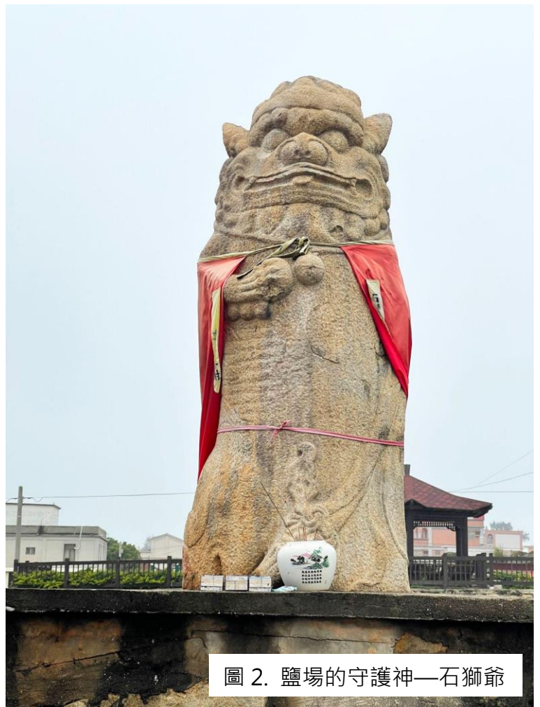
圖 2. 鹽場的守護神—石獅爺

抵達鹽場門口，一尊表情傳神的石獅爺映入眼簾。這裡風沙顯然沒有南端的大，也沒有在金門中央看到的紅土層。這也與金門的地理位置有關。金門四面環海，台地形態。西半部以紅土層構成的台地，顏色呈現漸次的深紅至淺紅。以花崗片麻岩構成的台地，是當地最古老的岩層，則主要分布於東半部，土壤呈棕色、白色。而鹽場所在的西園，則是花崗片麻岩的地帶。