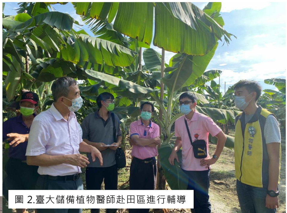
圖 2. 臺大儲備植物醫師赴田區進行輔導

臺大在雲林區已經持續推動推動 USR 計畫多年，最先得「臺大植物醫學團隊」於 107 年投入人力與資源，聘請學有專長的實習植物醫學專業人員於雲林縣在地服務，並與臺大專業教授群建立連結技術網絡，即時提供雲林農民疑難雜症之解答，包括植物病害、蟲害、合理化肥料施用與安全用藥等方面；巡迴於各地農會辦理農業技術諮詢講習會，針對各鄉鎮主要農作物進行病蟲害診斷及監測。