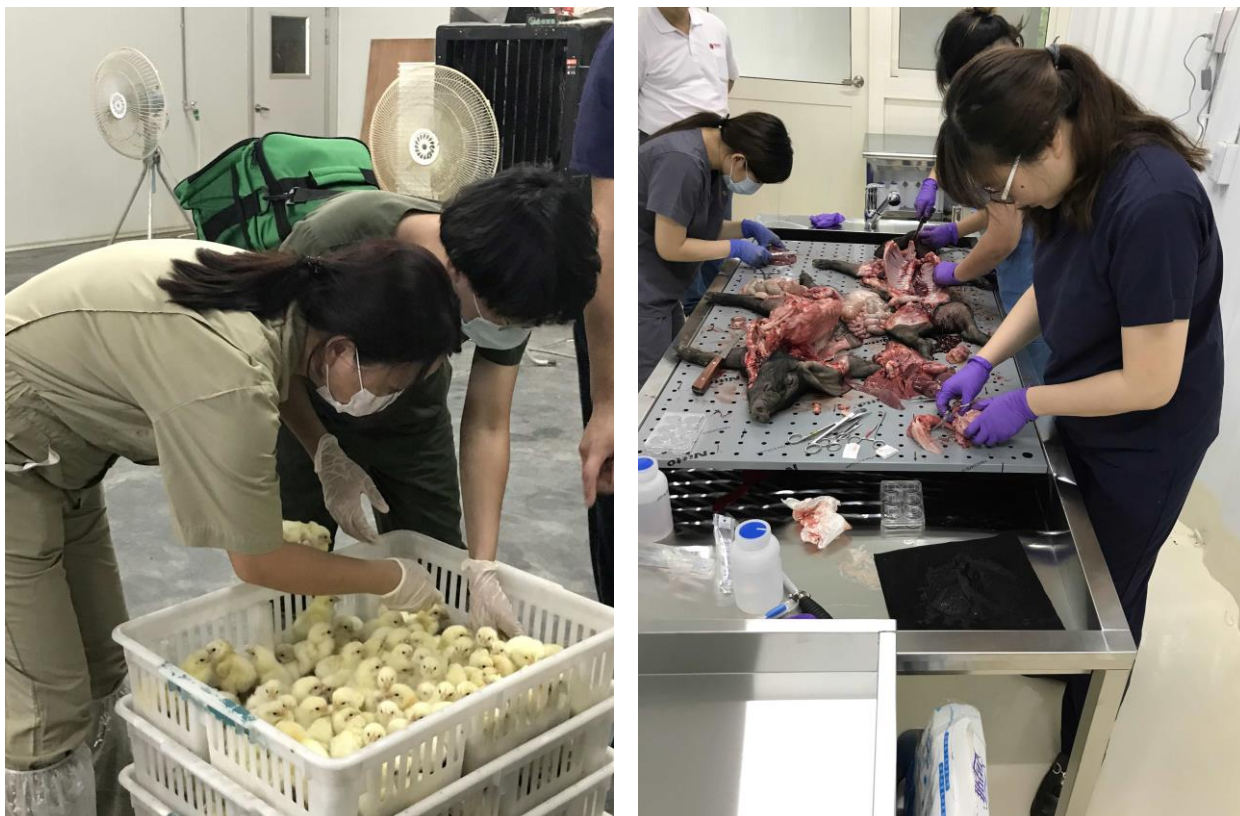
圖 4、圖 5 臺大獸醫團隊在雲林地區的家禽場檢查(左)、解剖病豬(右)

雲林是臺灣的農業大縣，也是全臺養豬頭數最多縣市，臺大為提供更多的在地服務，於 108 年成立「臺大動物疾病診斷中心雲林分部」由臺大獸醫專業團隊進駐本校雲林分部，針對畜禽產業疾病防治與飼養管理，提供優質的診療服務。近年亦擴大至雲林縣家禽、草食及水產動物等相關產業動物疾病診治與飼養管理，進行輔導及防治服務等項目。