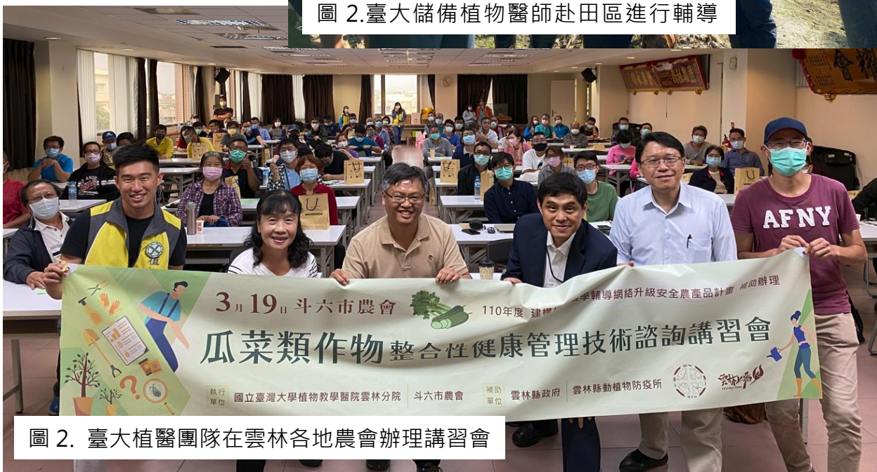
圖 2. 臺大植醫團隊在雲林各地農會辦理講習會