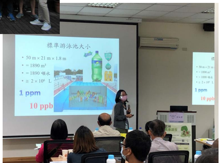
圖 7. 農推會在臺大雲林分部辦理農推講座