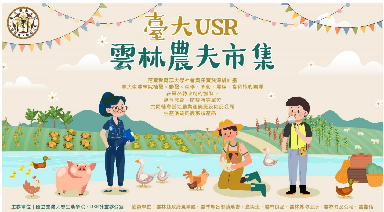
圖 1. 臺大USR 雲林農夫市集主視覺

臺灣大學響應教育部大學社會責任 (USR, University Social Responsibility) 的號召，生物資源暨農學院執行的USR深耕型的「攜手•雲林」計畫已於112年11月11-12日在校內鹿鳴堂廣場旁舉辦「臺大USR 雲林農夫市集」，邀請由臺大植物醫師團隊、動物醫師團隊所輔導之農民、農會及畜牧場等單位，將其生產的優質農畜牧產品，帶到市集現場進行展售與推廣，為此第三期的USR計畫繳出亮眼的成績單。