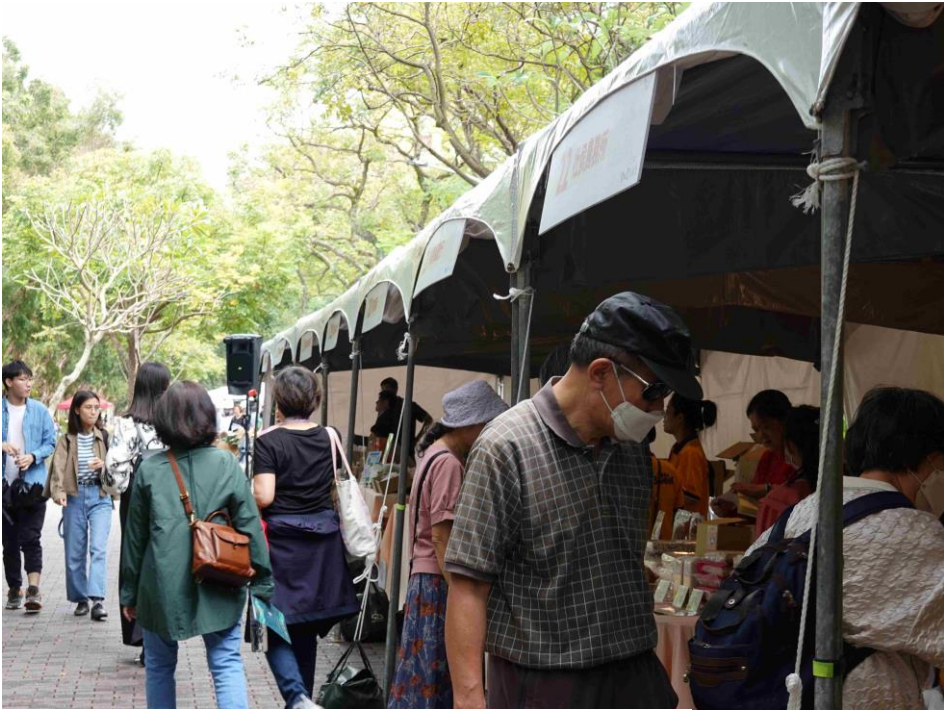
圖 8、圖 9 「臺大 USR 雲林農夫市集」一角