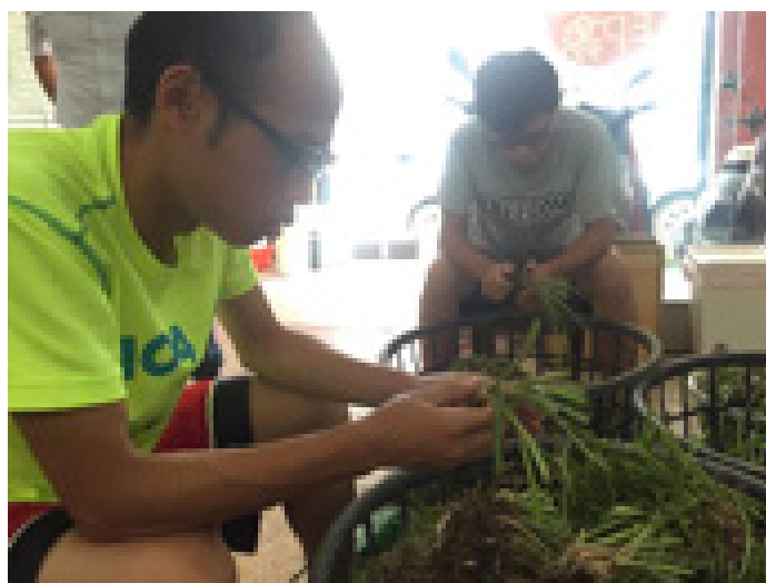
任慶洪同學正在實際參與農事